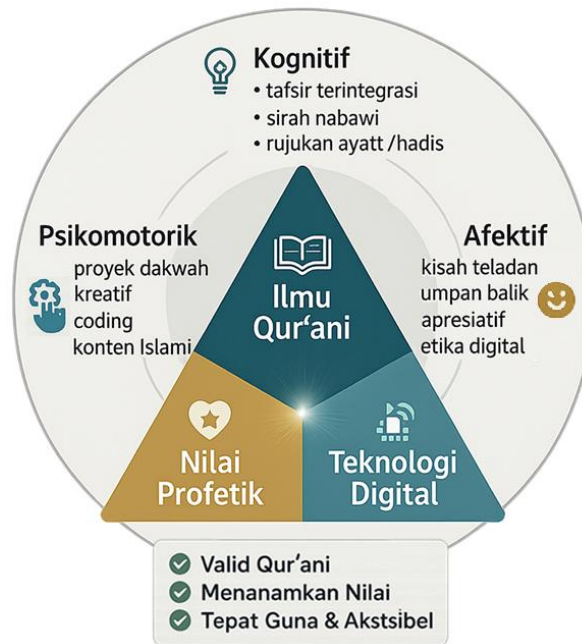
Gambar 2. Model konseptual Media Digital Profetik (hasil sintesis kajian literatur)

Kerangka konseptual Media Digital Profetik yang dihasilkan dari sintesis literatur digambarkan pada Gambar 2. Secara visual, model tersebut memperlihatkan segitiga integratif antara tiga komponen kunci: Ilmu Qur'ani, Nilai Profetik, dan Teknologi Digital. Ketiganya bertemu di satu titik tengah yang disebut Media Digital Profetik. Titik pertemuan ini merepresentasikan media pembelajaran PAI yang ideal, dimana pengetahuan agama yang bersumber dari Qur'an dan Hadis (ilmu) dipadukan dengan penanaman nilai-nilai profetik menggunakan sarana teknologi digital mutakhir. Di sekitar segitiga, terdapat tiga lingkup pengembangan peserta didik yang dicakup oleh model ini, yaitu dimensi kognitif, afektif, dan psikomotorik.