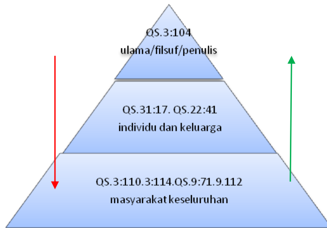
Gambar 3 Kerucut Masyarakat Muslim, adaptasi dari Ali Shariati, A Glance at Tomorrow's History 36