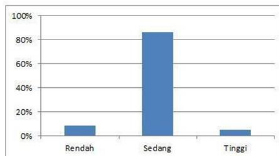
Gambar 1. Profil Pemahaman Kesetaraan Gender Mahasiswa Fakultas Tarbiyah dan Keguruan

Hasil penelitian menunjukkan bahwa mahasiswa Fakultas Tarbiyah dan Keguruan UIN Antasari Banjarmasin yang memiliki kategori pemahaman kesetaraan gender rendah berjumlah 7 orang atau sebesar 8,86%, mahasiswa yang memiliki kategori pemahaman kesetaraan gender sedang berjumlah 68 orang atau sebesar 86,08%, dan mahasiswa yang memiliki kategori pemahaman kesetaraan gender tinggi berjumlah 4 orang atau sebesar 5,06%. Adapun deskripsi pemahaman kesetaraan gender mahasiswa Fakultas Tarbiyah dan Keguruan UIN Antasari Banjarmasin UIN Antasari Banjarmasin dapat dilihat pada diagram berikut: