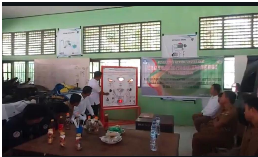
Gambar 3. Penjelasan Simulator Sistem Penerangan Sepeda Motor

Kegiatan pembahasan beserta hasil yang dilakukan Tim PKM dalam pengujian penggunaan oleh mitra. Kejadiannya yaitu penjelasan penggunaan simulator, uji coba penggunaan simulator serta tahapan akhir penyerahan simulator. Setelah semua komponen berhasil dirakit, maka akan dilakukan tahapan penjelasan penggunaan simulator. Tahapan pembuatan dudukan peralatan praktikum berbagai macam model, konstruksi bentuk rangkanya berdasarkan pemilahan ketahanan untuk menopang beban yang ada pada setiap bagian-bagiannya (Setiawan et al., 2015). Pada waktu rangkaian simulator sistem penerangan sepeda motor dinyalakan, ternyata bekerja sesuai dengan harapan. Hasilnya terlihat pada Gambar 3 berikut.