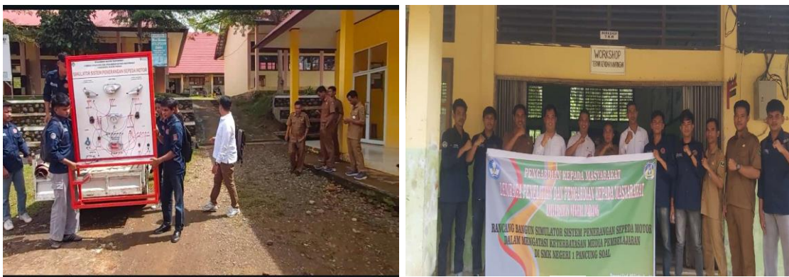
Gambar 1. (a) Simulator Sistem Penerangan Sepeda Motor; (b) Tim PKM Bersama Mitra

Kegiatan pengabdian masyarakat ini bertujuan untuk merancang dan menerapkan simulator sistem penerangan sepeda motor sebagai media pembelajaran guna mengatasi keterbatasan fasilitas praktik di SMK Negeri 1 Pancung Soal. Penggunaan simulator tersebut diharapkan dapat meningkatkan pemahaman, keterampilan, serta keaktifan siswa dalam praktik sehingga mendukung kesiapan kerja lulusan. Sistem penerangan pada sepeda motor juga memiliki peran yang sangat penting, terutama saat berkendara pada malam hari, karena membantu pengendara mengenali objek dalam kondisi gelap. Spesifikasi alat merupakan informasi yang disampaikan untuk menggambarkan karakteristik simulator sistem penerangan (Ikhsan et al., 2018). Selain itu, sistem penerangan berfungsi sebagai pemberi tanda peringatan untuk meningkatkan kewaspadaan terhadap objek yang tampak samar atau tidak jelas pada kondisi berkabut, yang dapat berpengaruh negatif terhadap jarak pandang pengguna. Sistem penerangan sepeda motor mencakup penerangan bagian luar dan bagian dalam. Pada bagian luar sepeda motor, penerangan meliputi lampu kabut/lampu senja, lampu sein, lampu kepala, lampu rem, dan lampu belakang. Oleh sebab itu, Tim PKM berinisiatif mengembangkan simulator sebagai media atau alat praktik yang dapat membantu meningkatkan keterampilan guru dan siswa dalam mempelajari sistem penerangan sepeda motor (Yanto et al., 2022).