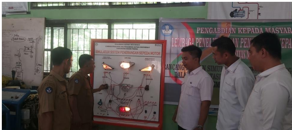
Gambar 4. Uji Coba Simulator Oleh Mitra

diharapkan dapat menunjukkan kemampuan mereka dalam menggunakan dan menjalankan seluruh prosedur yang terdapat pada simulator tersebut (Dumatubun et al., 2022). Pengujian ini bertujuan untuk mengetahui apakah seluruh guru yang mengajar pada bidang otomotif dapat memanfaatkan media pembelajaran tersebut sebagai sarana praktik dalam proses pembelajaran di bengkel bersama siswa pada mata pelajaran yang relevan (Aripurnomo et al., 2023).