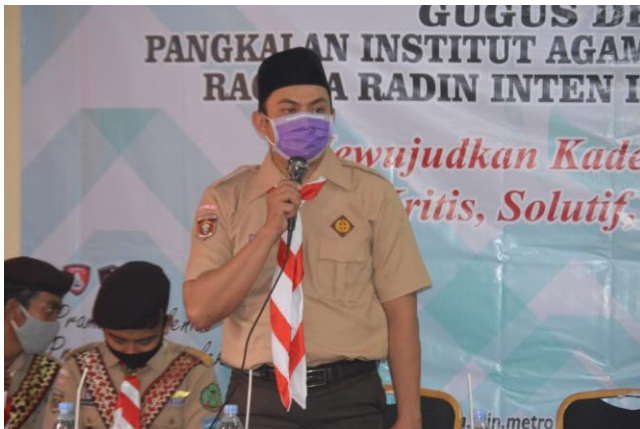
Gambar 1. Memberikan Materi Nilai-Nilai Pendidikan Berbasis Karakter

mengikuti atau meniru tata perilaku di sekitarnya, pengambilan pola perilaku dan nilai-nilai baru, serta tumbuhnya idealism untuk pemantapan identitas diri. 49 Karena hal itu maka tugas seorang pendidik, orang tua atau bahkan masyarakat adalah memberikan contoh perilaku yang positif. Agar apa yang dilihat dan ditiru oleh anak dapat menjadi karakter yang positif pula bagi anak itu sendiri. Untuk membentuk karakter positif pada anak, perlu dibiasakan pada hal-hal yang baik.