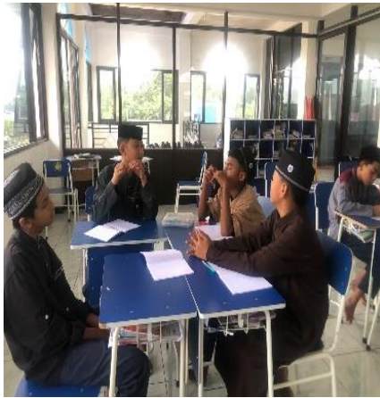
عملية التعلم الجماعي حسب لفرقة