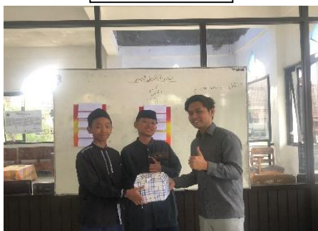
إمناح الجائزة إلى الفرقة الفائزة