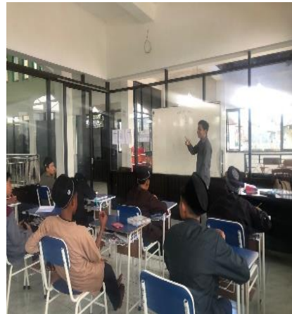
تقديم الفصل من قبل المعلم