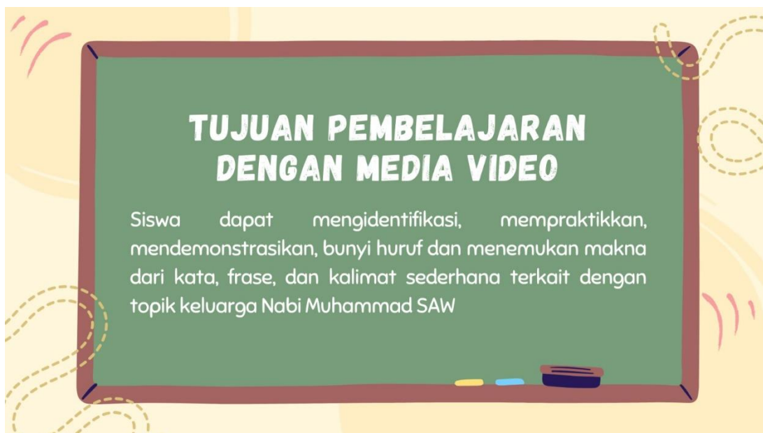
صورة ٢. صفحة أهداف التعليم

إعداد صفحة نص الحوار، فالحوار في الفيديو يضاف إليه الصور المتحركة مع الأصوات من الأشخاص ذوي الصوت الفصيح بالعربية الفصحى.