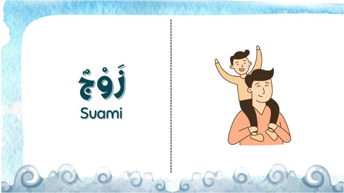
صورة ٤ . صفحة مفردات الجديدة

علاوة على ذلك، يمكن أن تساعد قدرة تطبيق Canva على تسهيل إنشاء مواد تعليمية جذابة بصريا وجذابة المتعلمين على تطوير اهتمام أقوى بتعلم اللغة العربية، وهو أمر بالغ الأهمية لتحسين مهارات التحدث. من خلال جعل التعلم أكثر متعة وتفاعلية، يمكن ل Canva تحفيز المتعلمين على ممارسة التحدث باللغة العربية بشكل متكرر وبثقة أكبر. في اختبار الخبراء، قدم الباحث التطبيق إلى خبيرين، هما خبير المواد التعليمية، وهو الأستاذ الدكتور أوريل بحر الدين في جامعة مولانا مالك إبراهيم مالانج، وخبير تكنولوجيا التعليم وهو الدكتور واهب داريادي من جامعة مالانج الحكومية. وأما خبير المواد وهو الأستاذ الدكتور أوريل بحر الدين المحاضر في جامعة مولانا مالك إبراهيم الإسلامية الحكومية، مؤلف كثير من الكتب والمقالات وكذا المحاضر في العديد من المحاضرات المتعلقة بتعليم اللغة العربية. 18 ومن مؤلفاته هو كتاب تطوير منهج تعليم اللغة العربية (٢٠١٠)، مهارات التدريس (٢٠١١)، فقه اللغة العربية؛ مدخل لدراسات موضوعات فقه اللغة (٢٠٠٩)، تعليم اللغة العربية: مدخله، طريقته، استراتيجيته، محتواه، ووسيلته (٢٠٠٨) وغيرها من الكتب والمقالات التي لا تخص مجال تعليم اللغة العربية فقط بل توجد غيرها في مجالات مختلفة. ونال درجة الأستاذية في ٢٠٢٢م وإنه أول من نالها في قسم تعليم اللغة العربية بجامعة مولانا مالك إبراهيم. ونتيجة الاستبانة كما يلي: