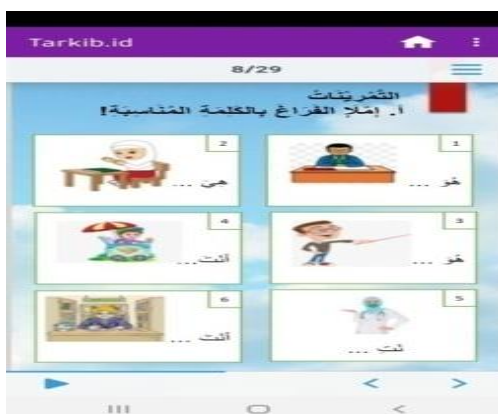
الصورة ٥ أسئلة التدريب