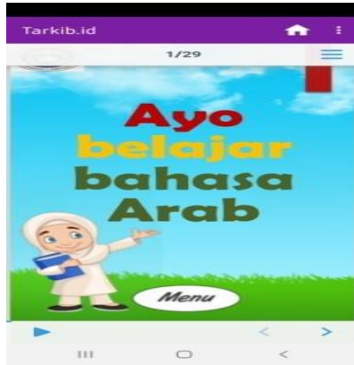
الصورة ١ غلاف التطبيق

يتكون كل نشاط تعليمي من مكونات أهداف التعلم، وأوصاف المواد، والملخصات، وأسئلة التدريب في شكل اختيار من متعدد. صفحة الغلاف الخاصة بمنتج التطبيق هي صفحة العنوان وهوية المستخدم. صفحة عنوان التطبيق "هيا بنا نتعلم اللغة العربية". لجذب انتباه الطلاب، تم تجهيز صفحة العنوان برسوم متحركة لرسوم متحركة للأطفال. يمكن رؤية لقطة شاشة لصفحة العنوان في الصورة.